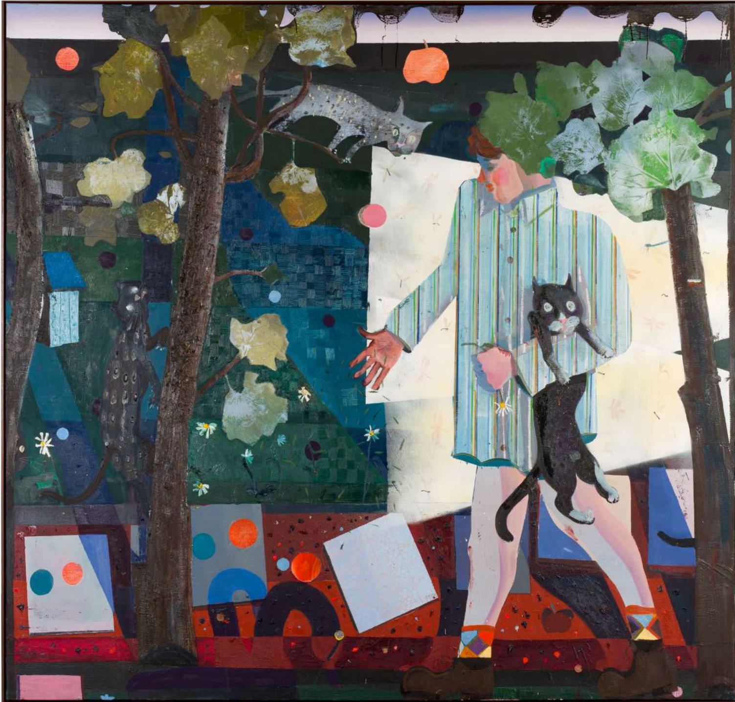
things behind the sun, 2022 Oil and mirrors on canvas 74 3/4 x 78 3/4 in 190 x 200 cm (PJE23.008)