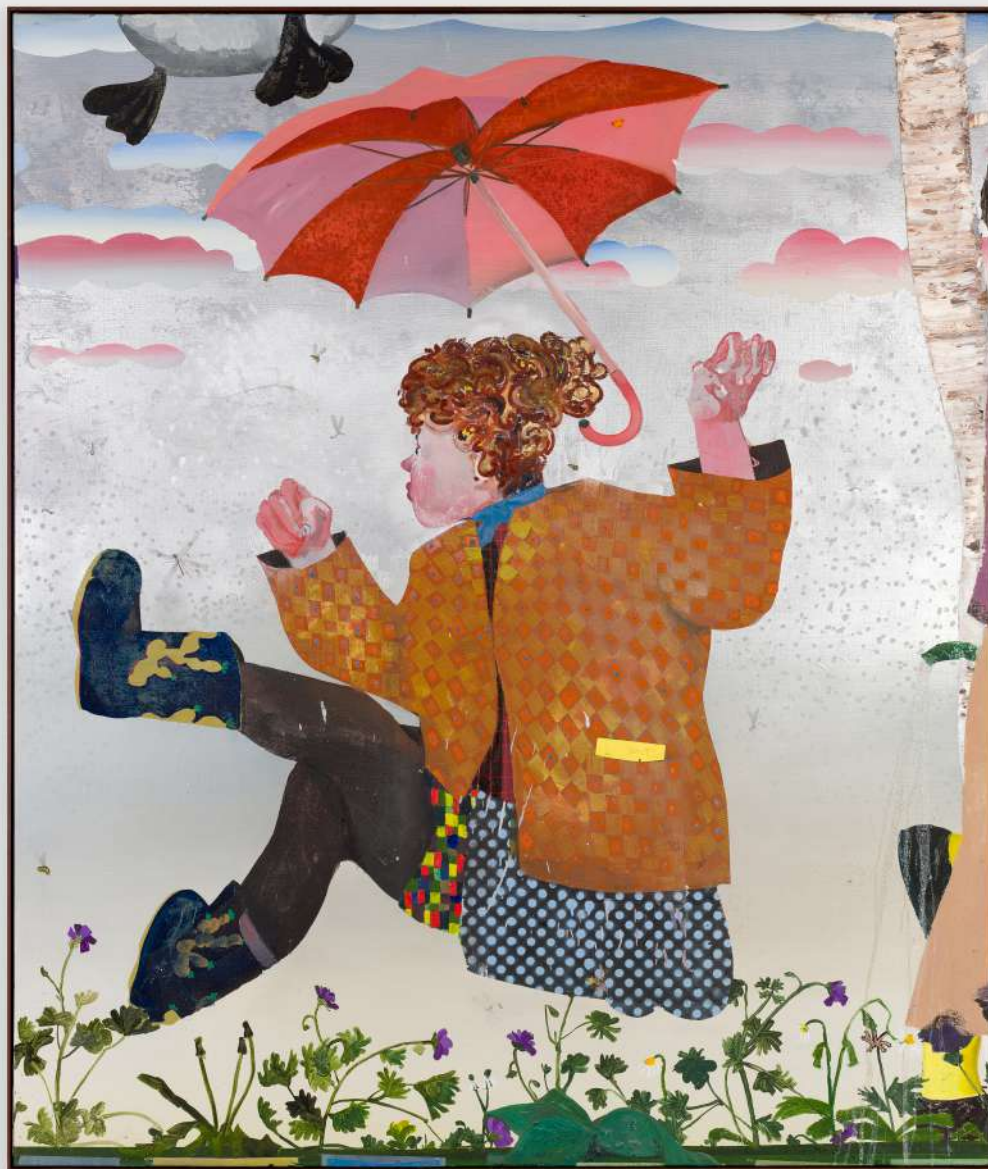
what would it sound like if you were a songwriter , 2022 Oil on canvas 70 7/8 x 59 in 180 x 150 cm (PJE23.010)