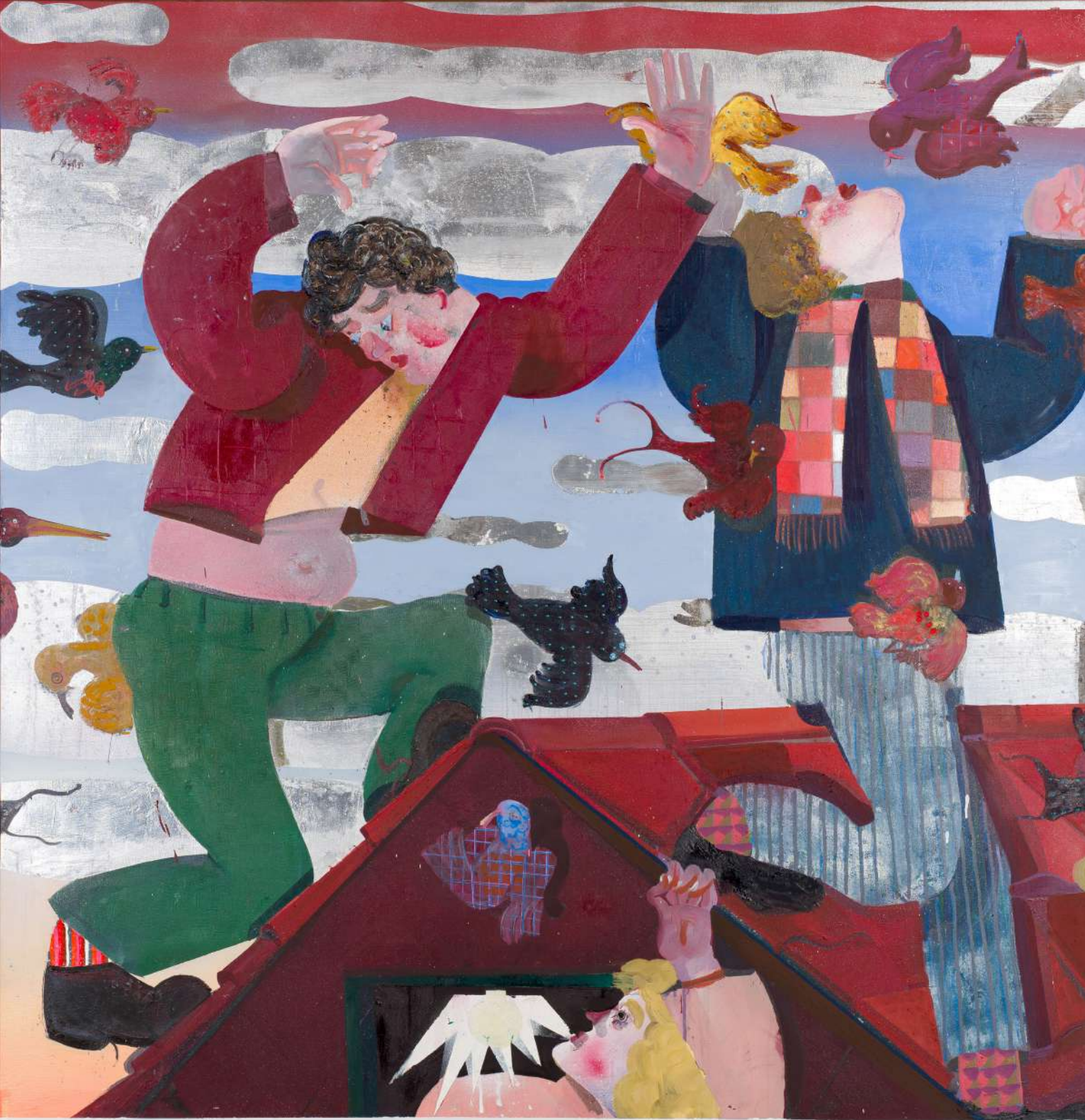
What are you doing now? , 2022 Oil and collage on canvas 70 7/8 x 66 7/8 in 180 x 170 cm (PJE23.003)