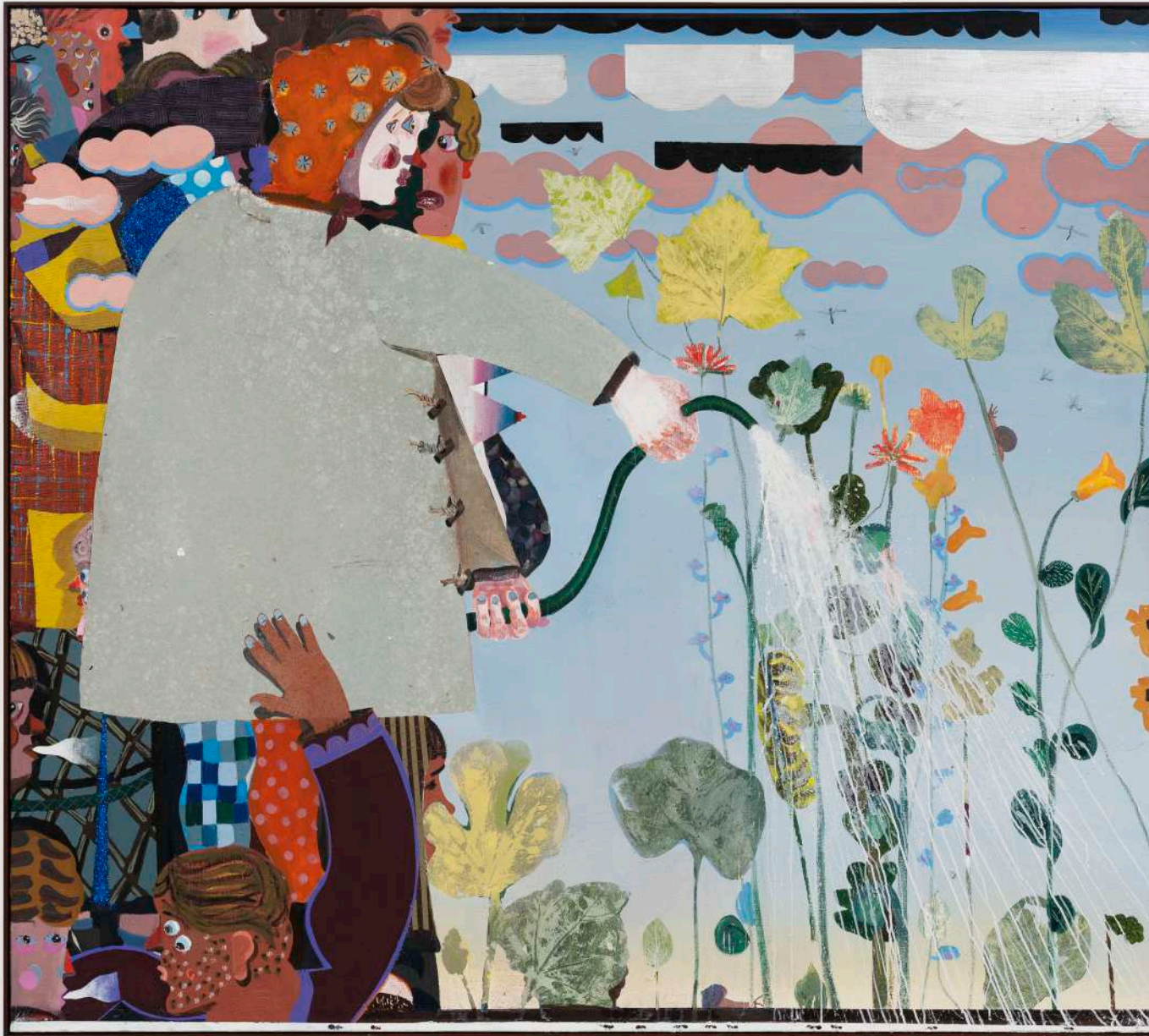
When weeds bloom , 2021 Oil and glitter on canvas 67 x 75 3/4 x 1 3/4 in (framed) 170.2 x 192.4 x 4.4 cm (framed) (PJE22.006)