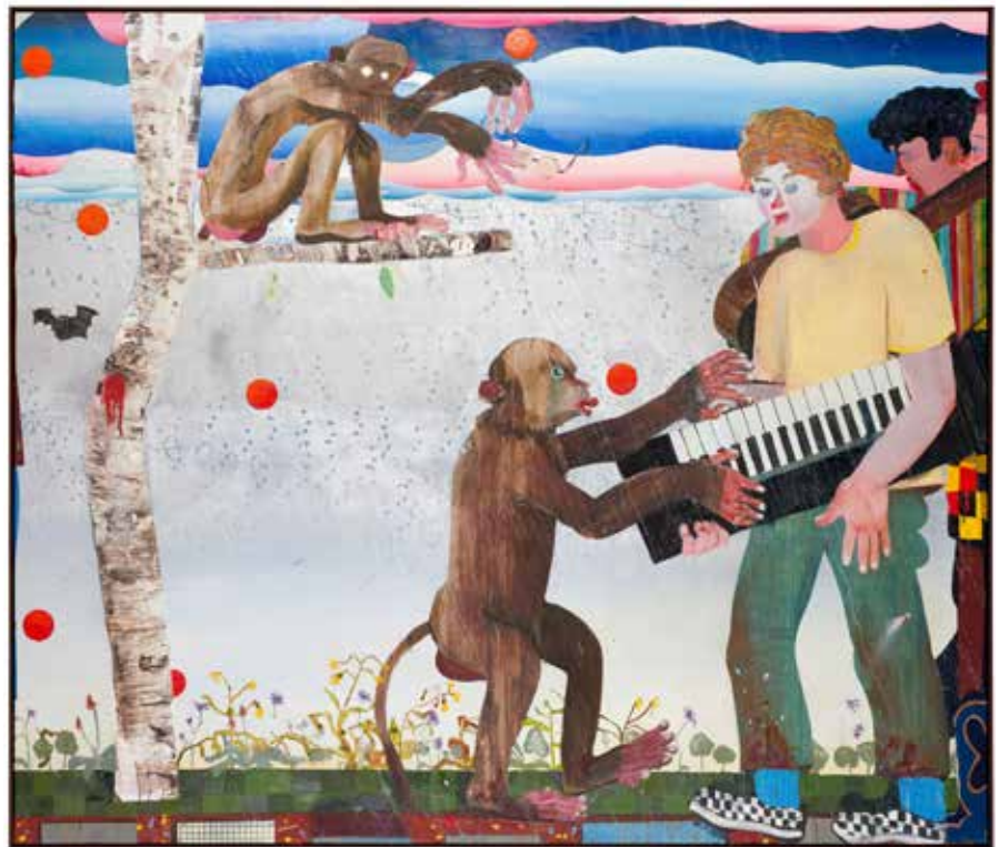
Pieter Jennes, A typical morning , 2022, olieverf en collage op doek, 170 x 200 cm. Met toestemming van Gallery Sofie Van de Velde and Nino Mier Gallery. Foto: Joost Joossen.

vormt vooral een excuus om een bepaalde sfeer te creëren. Terwijl de achtergrond de werken aan elkaar verbindt, beleven de personages volgens de logica van een kinderboek een verhaal. Daarbij zie ik er nauw op toe dat geen enkel werk inwisselbaar is. Tegelijk zal elk werk in een andere context nieuwe verhalen genereren.”