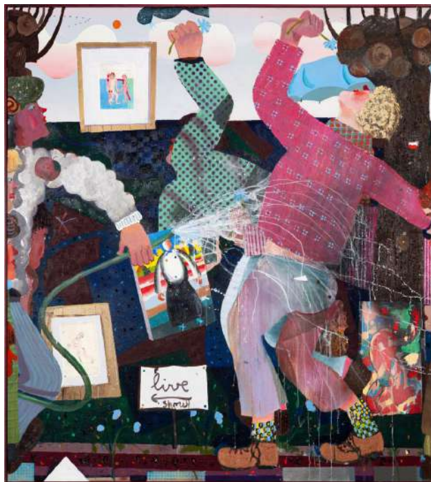
Pieter Jennes, Unfulfilled Karma , (2022).

The energy was palpable in the Windy City during the lead-up to the latest edition of Expo Chicago, the city's decade-old anchor art fair. In full post-pandemic swing, the city is hosting a wide range of programming, including artist-led talks and tours, museum shows, satellite fairs (such as the artist-run Barely Fair), public art installations (including Art on the Mart), and pop-ups like the popular roving Art in Common show, which opened to crowds in the Fulton Market neighborhood last night.