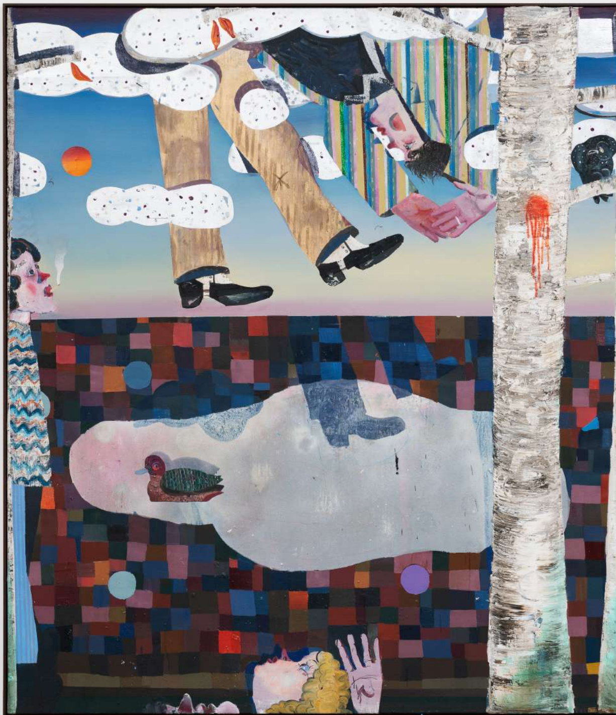
reflections: tips and clues, 2022 Oil and glitter on canvas 79 3/4 x 67, 3/4 x 1 3/4 in (framed) 202.6 x 172.1 x 4.4 cm (framed) (PJE22.008)