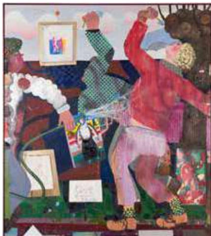
Pieter Jennes, Unfulfilled Karma , 2022, olieverf en collage op doek, 190 x 170 cm.

Zoals wel vaker vertrok Pieter Jennes voor zijn huidige expositie bij Be-Part in Kortrijk van een historisch verhaal, dat de werken als een losse rode draad met elkaar verbindt. Toen dissidente kunstenaars in 1974 in Moskou een openlucht tentoonstelling organiseerden, werd die ontmanteld door een als groendienst verklede knokploeg. Hoewel deze Bulldozer exhibition de aanzet gaf voor de reeks, zijn er onderweg allerlei deelverhalen bijgekomen. Jennes: “Het verhaal